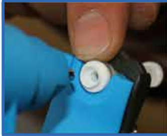
Agujero no usado

① Asegúrese de que la pinza este cargada con una Unidad para Muestras nueva (si es una unidad usada podrá ver una marca color rojo)